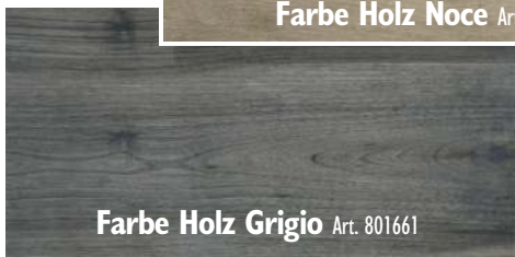
Farbe Holz Grigio Art. 801661