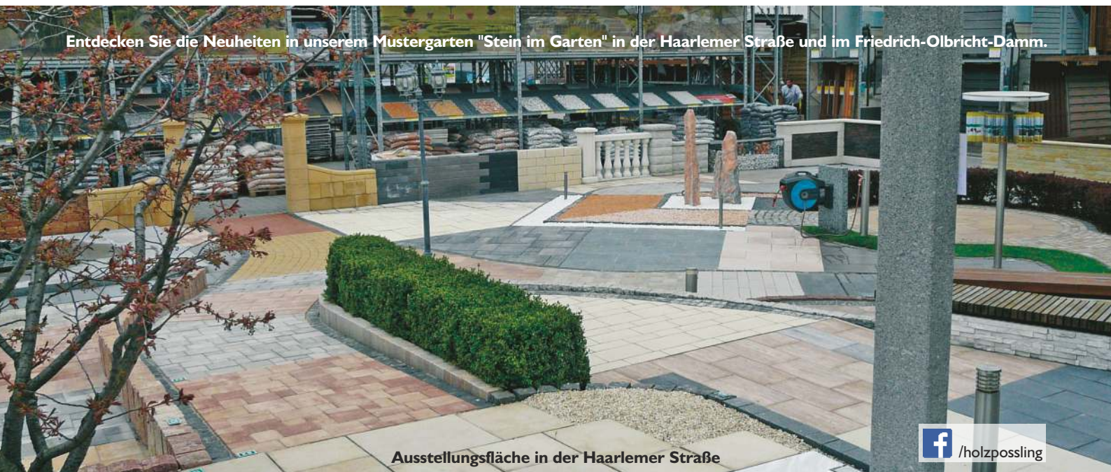
Ausstellungsfläche in der Haarlemer Straße

Entdecken Sie die Neuheiten in unserem Mustergarten "Stein im Garten" in der Haarlemer Straße und im Friedrich-Olbricht-Damm.