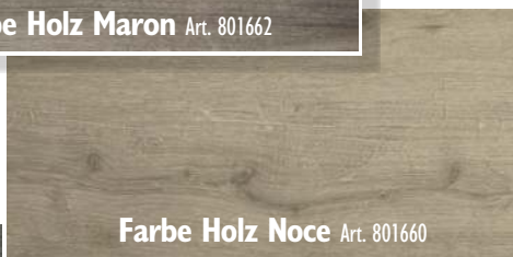
Farbe Holz Noce Art. 801660